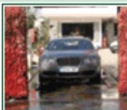
Lavaderos de vehículos